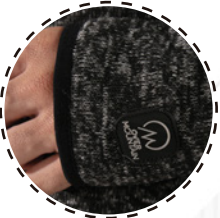
TERMINACIÓN EN MANGA CON VIVO