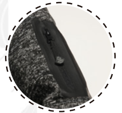
BOLSILLO CON CIERRE EN MANGA

CHAQUETA KNIT FLEECE (tejido exterior melange interior fleece) actúa como segunda capa siendo una prenda liviana y confortable.