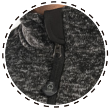
TIRADOR CON MARCA OVER MOUNTAIN