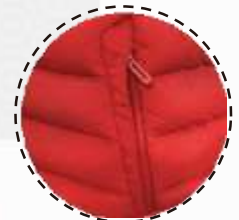
BOLSILLOS CON CIERRE

La parka térmica Pukem con tecnología Thermo-Pipe de paneles integrados con calor, crea una barrera contra el viento y las bajas temperaturas al eliminar los orificios del acolchado tradicional.