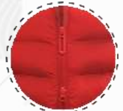
CIERRE DE DOS VÍAS