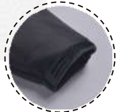
PUÑOS ELASTICADOS Y AJUSTABLES CON VELCRO

T-WORLD , es ropa corporativa de alta calidad, diseñada con estilo único, acompañando a los trabajadores y empresas de todo Chile.