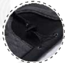
AJUSTE CON TANKAS eN CADeRA