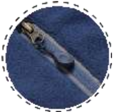
CIERRE cOn ApLicAción reflectiva