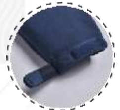
mAnGA cOn velcro

T-WORLD , es ropa corporativa de alta calidad, diseñada con estilo único, acompañando a los trabajadores y empresas de todo Chile.